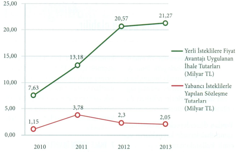
Şekil 6.1. Yerli istekli lehine uygulanan avantajların, yabancı isteklilerin ihalelere katılımına etkisi

Sonuç olarak, ihaleye girerken aday veya isteklinin %15'e kadar fiyat avantajı sağlaması için teklif ettiği